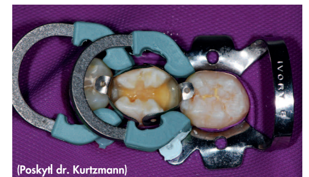
Na sebe kladené klínky při ošetření parodontologického případu