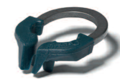
Úzké pro premoláry