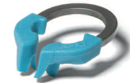
Univerzální pro moláry

Silné NiTi kroužky pro vynikající pevnost pružení a paměť, až 1000x sterilizovatelné v autoklávu